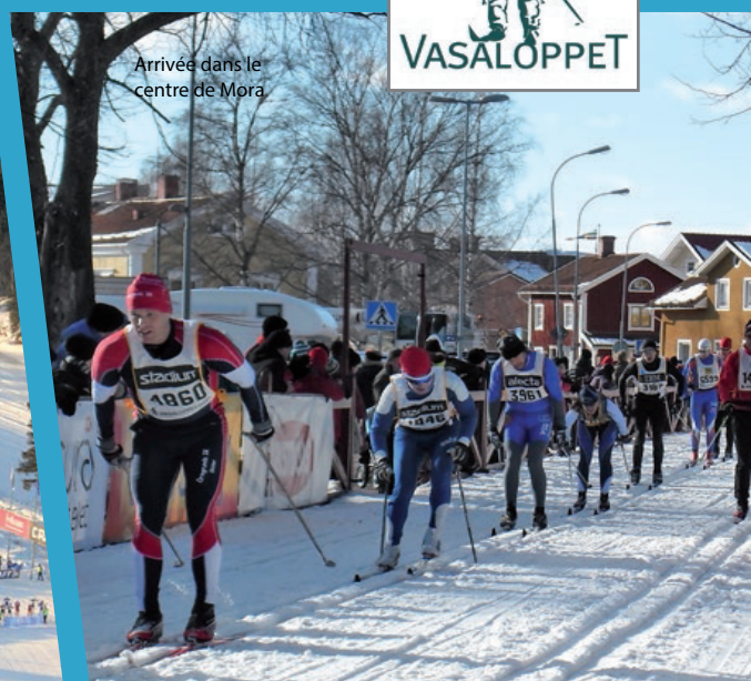
Arrivée dans le centre de Mora

SÉJOUR 5 JOURS / 4 NUITS D'HÔTEL : | 160 €*